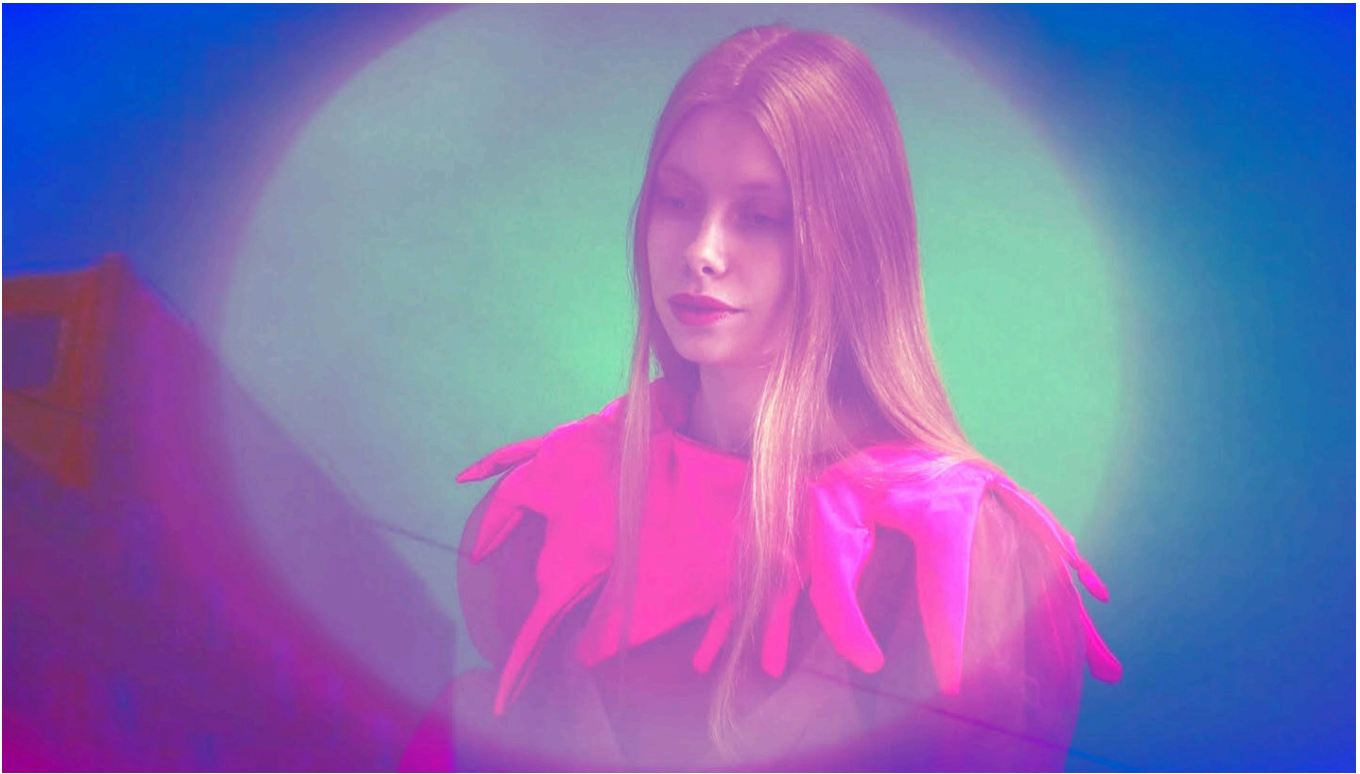
Astrid Vandercamere, Follow the Yellow Brick Road , 3'36, 2020.