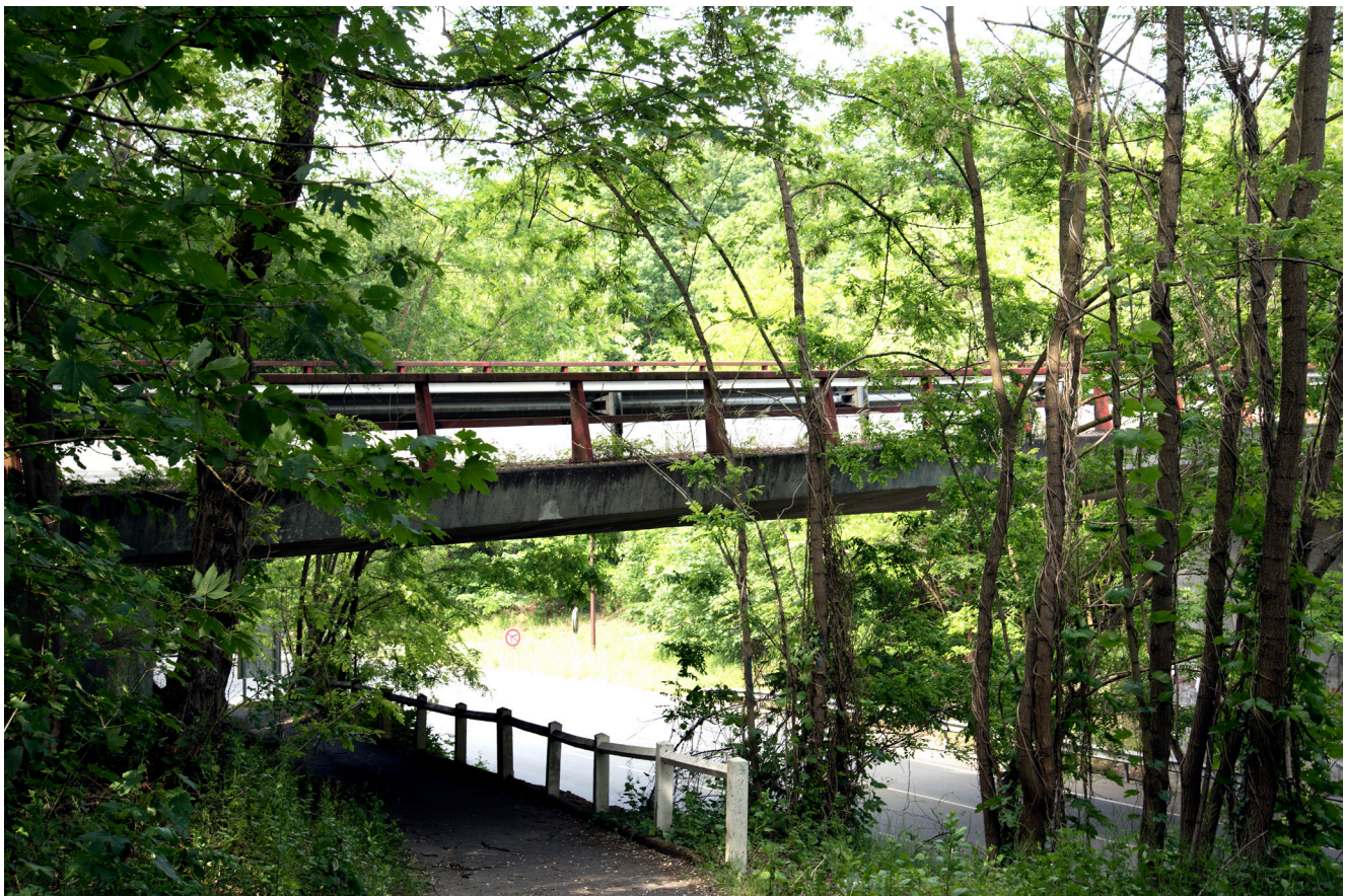
Gwen Lebette, Bunker Hostels , tirage photo sur dos bleu, 160*110 cm, 2020. ©Gwen Lebette