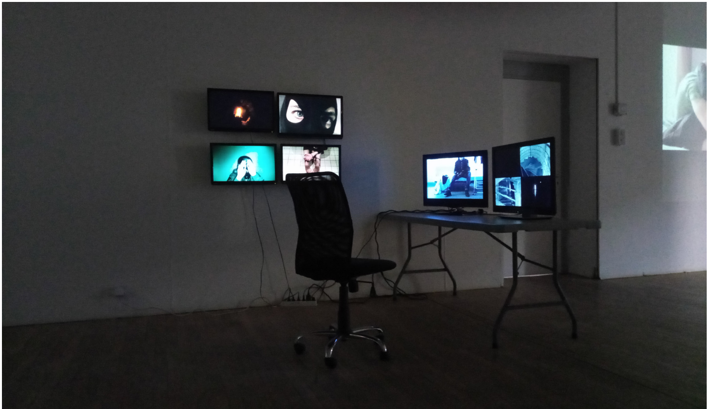
Louise Conduzorgues, Le poste , installation, ensemble de vidéos, 2020. © Louise Conduzorgues